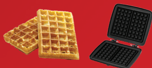
Gaufres traditionnelles 4X7 - M002