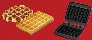
Gaufres de Bruxelles et de Liège 4X6 - M001

GRÂCE À SES 8 PLAQUES COMPATIBLES, IL S'ADAPTE À VOS GOÛTS ET VOS ENVIES