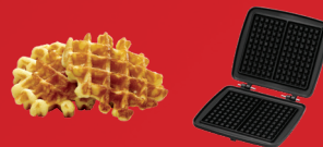
Gallettes 6X10 - M003