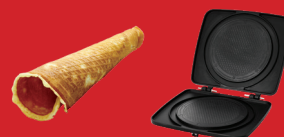
Cornet de glace M007