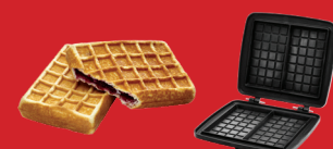
Gaufres Fourrées 4X7 - M008